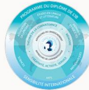
Programme du diplôme