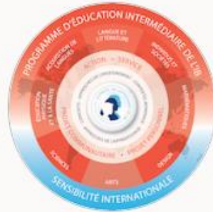
Programme d'éducation intermédiaire