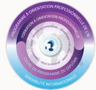
Programme à orientation professionnelle